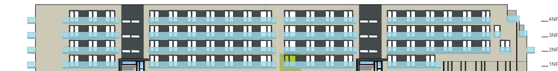
Severní pohled na dům / Building View - north side